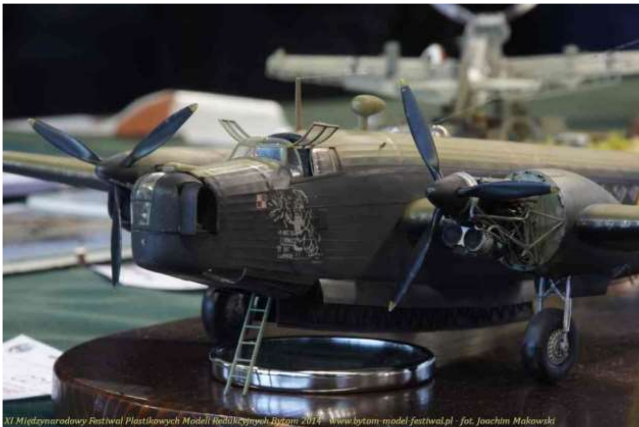
XI Międzynarodowy Festiwal Plastikowych Modeli Redukcyjnych Bytom 2014 www.bytom-model-festiwal.pl